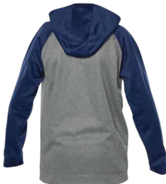
MARINE / MIX GRIS | NAVY / MIX GREY - DOS | BACK