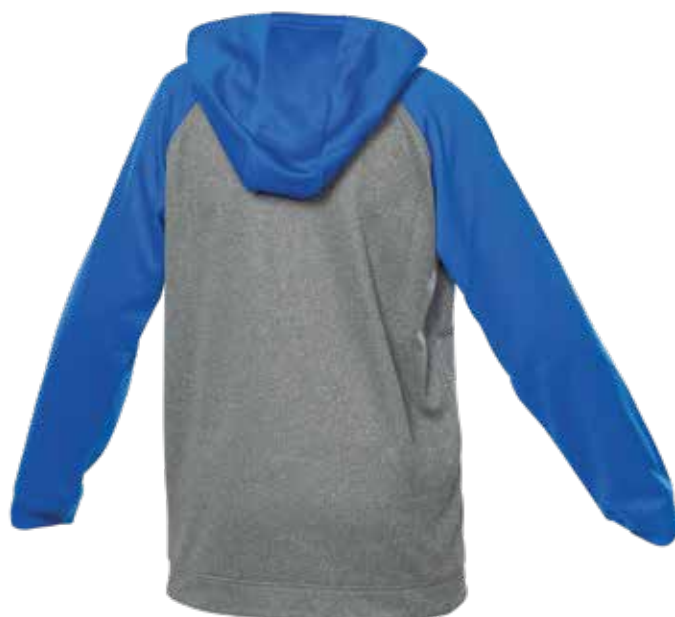
BLEU ROYAL / MIX GRIS | ROYAL BLUE / MIX GREY - DOS | BACK