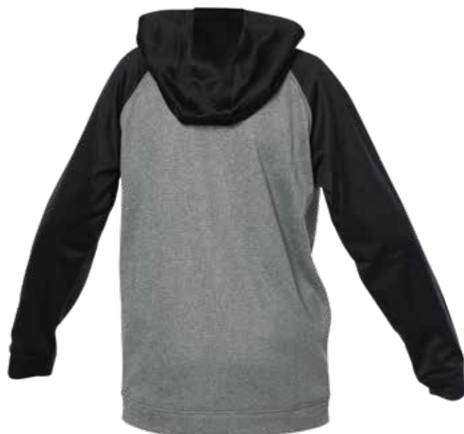
NOIR / MIX GRIS | BLACK / MIX GREY - DOS | BACK