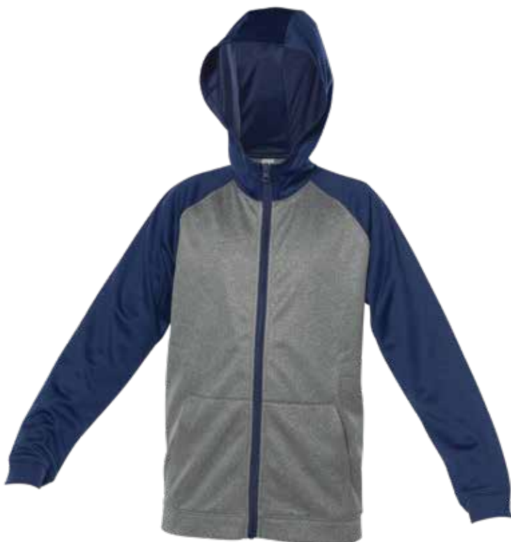
MARINE / MIX GRIS | NAVY / MIX GREY - DEVANT | FRONT