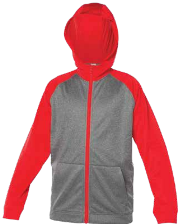
ROUGE / MIX GRIS | RED / MIX GREY - DEVANT | FRONT