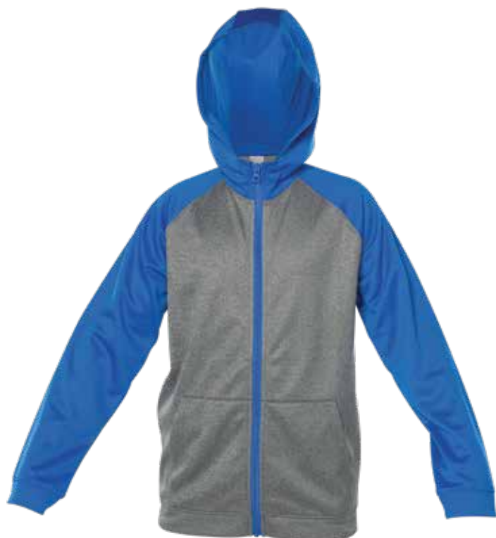
BLEU ROYAL / MIX GRIS | ROYAL BLUE / MIX GREY - DEVANT | FRONT