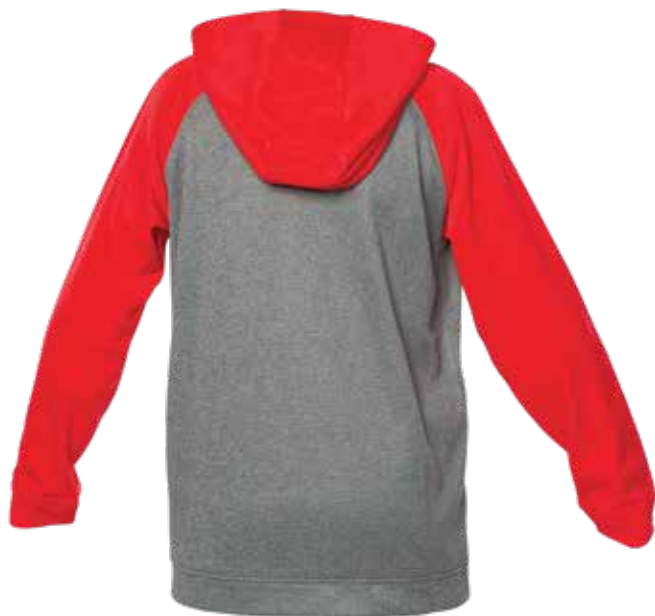
ROUGE / MIX GRIS | RED / MIX GREY - DOS | BACK