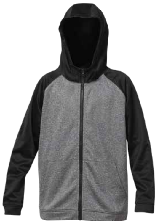
NOIR / MIX GRIS | BLACK / MIX GREY - DEVANT | FRONT