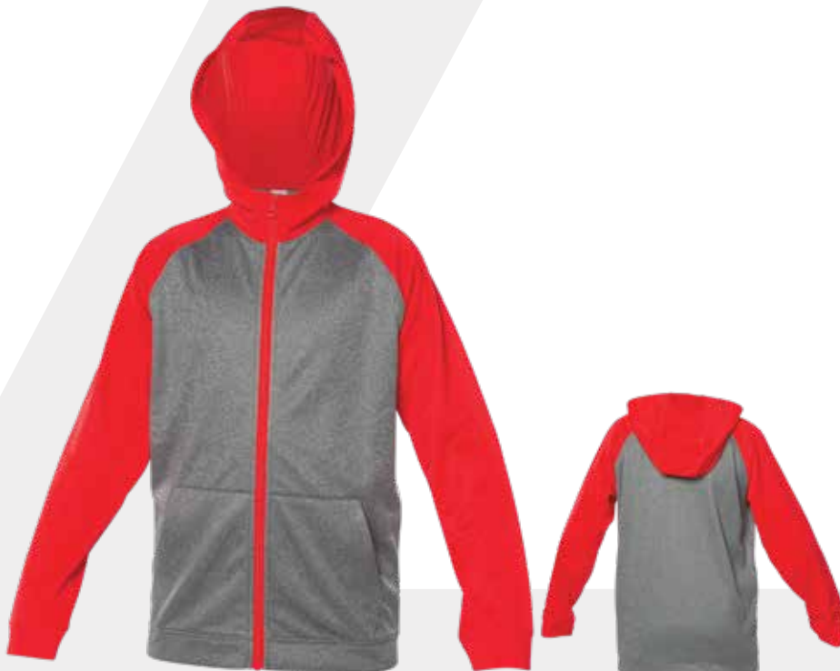
DEVANT | FRONT