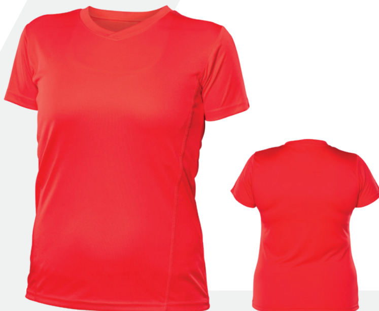
Devant | Front