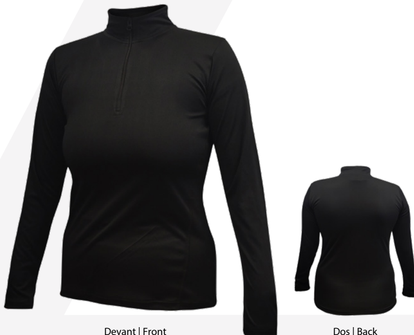
Devant | Front